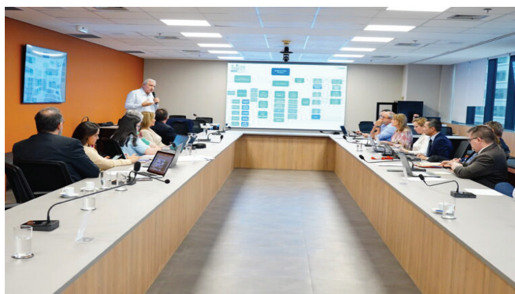
Dirigentes da CACB definem metas para 2024

Também recebeu parceiros, como o Conselho Brasileiro das Empresas Comerciais Importadoras e Exportadoras (CECIEx), que passará a ter um delegado por estado para auxiliar empresários do sistema a acessar novos mercados. O encontro também abordou novos projetos, entre eles, com a Agência Brasileira de Promoção de Exportações e Investimentos (ApexBrasil) para incentivar as pequenas e médias empresas a exportar.